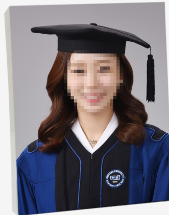
8R 학사복 아크릴액자(8 X 10 inch)