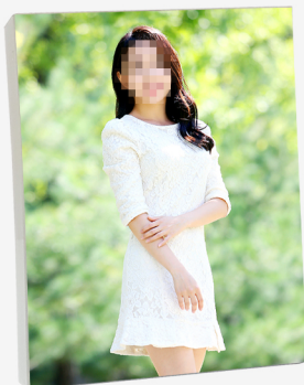
6R 야외이미지 아크릴액자(6 X 8 inch)