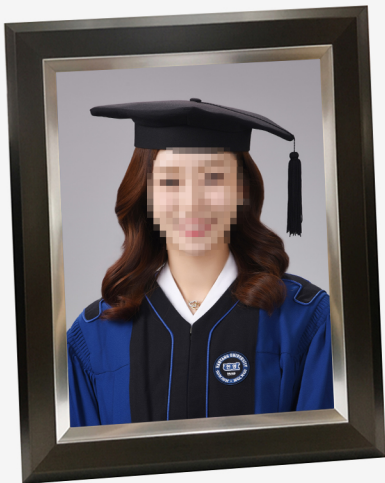
11R 학사복 나무액자(11 X 14 inch)